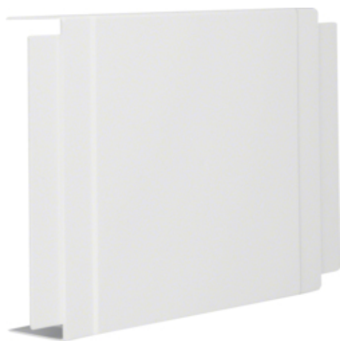
tehalit.LF Element T i krzyżak, 60x230mm, biały