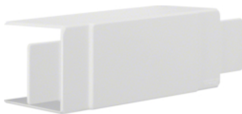
tehalit.LF Element T/X, 60x60mm, biały