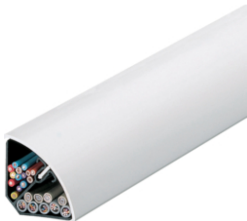
tehalit.EK Kanał narożnikowy 40040 L=2500mm biały