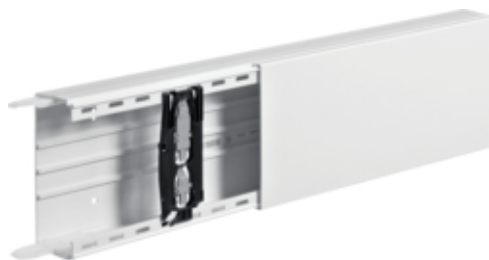
tehalit.LF Kanał elektroinstalacyjny PVC 60x150mm, biały