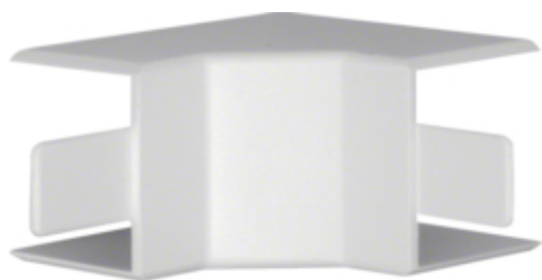
tehalit.LF/ateha Kąt wewnętrzny 30x30mm krem