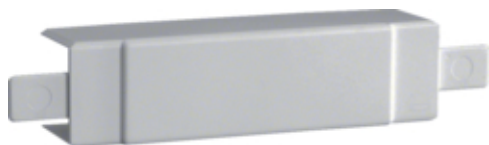
tehalit.LF Element T/X 20x35/36mm jasnoszary