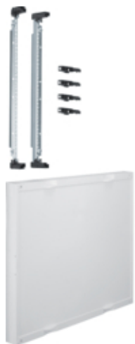
univers N Blok pusty 450x500mm